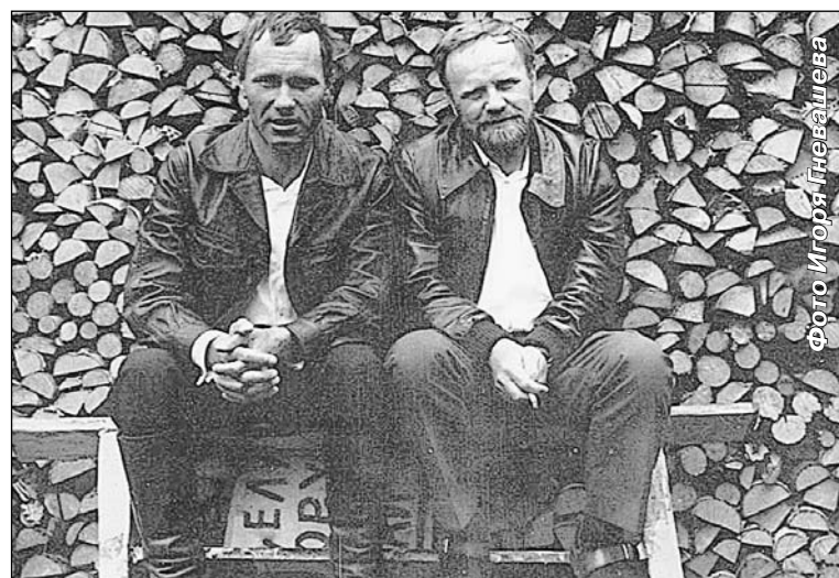
Василий Шукшин и Василий Белов на съёмочной площадке фильма «Калина красная»

Подробный рассказ о фестивале будет представлен в одном из ближайших номеров «ЛМ».