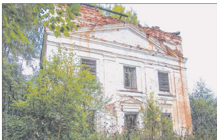
Церковь Покрова Пресвятой Богородицы в Горке Покровской. Фотография Александры Левиной

Сергей Владимирович с большой теплотой в зрелом возрасте вспоминал учебу в Березниковской земской школе: «На восьмом году я пошел в земскую школу в селе Березники, в двух с половиной километрах от нашей деревни. Нам преподавали немного предметов - русский язык по книге Ушинского «Родное слово», чистописание, географию, арифметику и обяза-