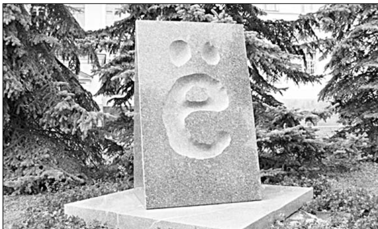
Памятник букве «Ё» в Ульяновске