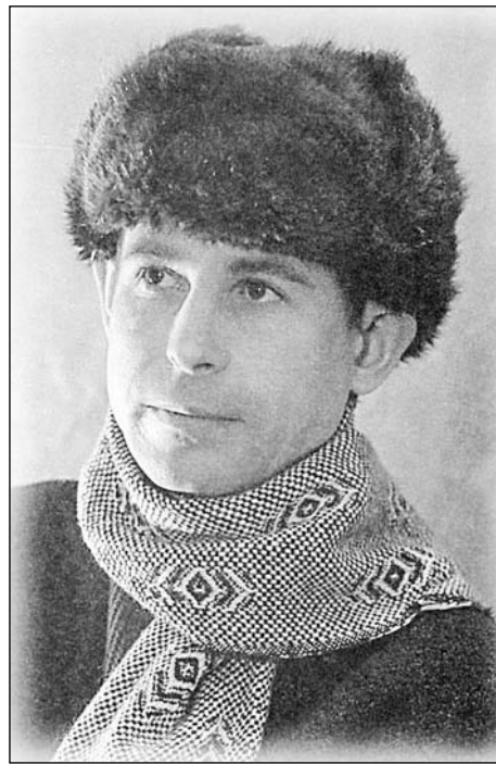
Николай Михайлович Рубцов (1936 - 1971 гг.)

Роднит их судьбы ранний, трагический уход из жизни: в 33 года - Гаршин, в 35 лет - Рубцов. Роднит и нереализованная творческая перспектива: тот и другой находились в расцвете сил и таланта и могли бы ещё многое сделать во славу русской словесности.