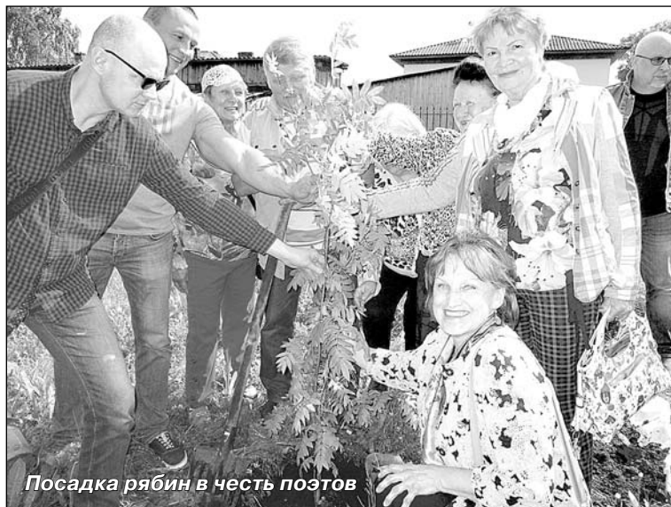
Посадка рябин в честь поэтов

казного патриотизма, о котором уже в 1965 году так писала газета «Вологодский комсомолец»: «... Юмор, светлая улыбка, органически влитые в его строки, создают аромат, который сразу чувствует и принимает читатель. Сочетание этого аромата и живописности поэзии автора позволило без вся-