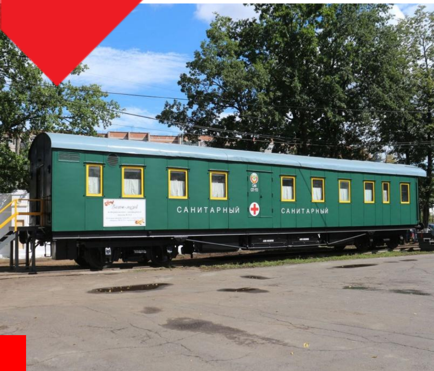
Музей вологодского санитарного поезда 312