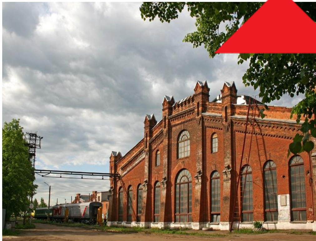
Музей истории ОАО «Вологодский вагоноремонтный завод»