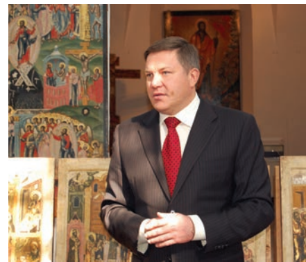
Губернатор Вологодской области Олег Кувшинников