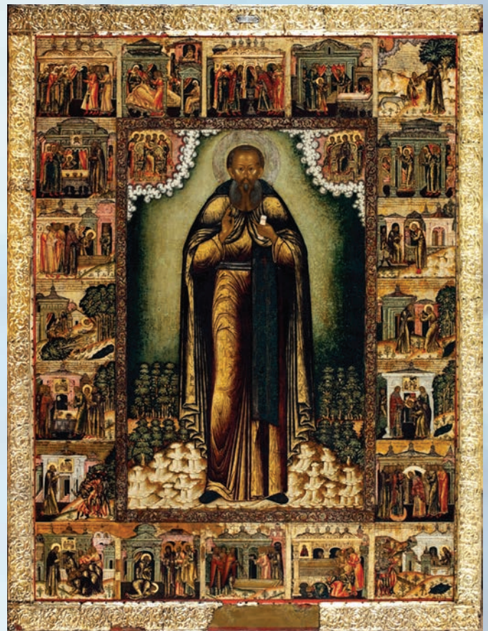
Преподобный Сергий Радонежский, с житием. Конец XVII в. Из церкви Сергия Радонежского. Павлока, левкас, темпера; оклад – серебро; басма

Интересна по исполнению написанная около 1669 года икона с образом святого Прокопия Устюжского с житием в 40 клеймах – вклад в Прокопьевский собор храмоздателя Афанасия Гусельникова. По желанию богатого заказчика вся огромная иконная доска была сплошь покрыта листочками сусального золота, по которому написаны миниатюры-клейма. Иконописец в мельчайших подробностях изобразил многострадальное житие и чудеса праведного Прокопия.