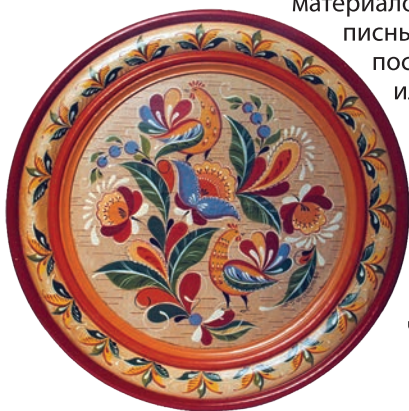
Уфтюгская роспись. Г. Н. Талалова