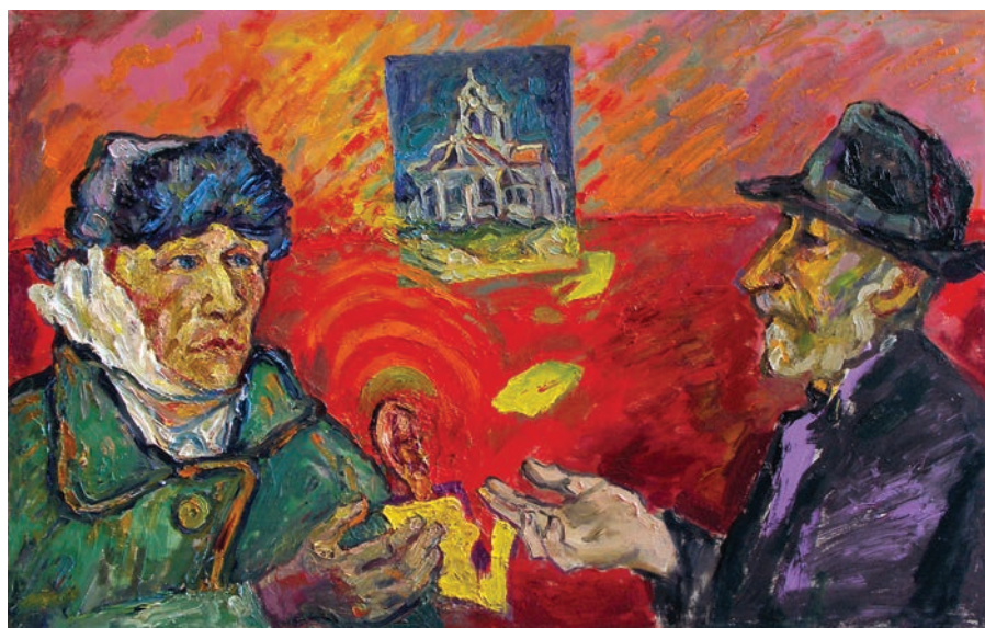
Ван Гог дарит свое ухо глухому художнику. 2009. Холст, масло. Собственность автора

экспериментировать, во-вторых – наблюдать за самим собой: что ты из себя представляешь как человек и как художник, как ты меняешься со временем. У меня около ста автопортретов, и недавно вышел альбом, в котором все они собраны. Вот первый из них – автопортрет 1943 года. Мне 21 год, я отпущен домой после ранения – еще и рисованию не учился нигде. А вот работа 2009 года – «На привязи», анималистический автопортрет: я изобразил себя в виде собаки. Это эксперимент, сочетание живописи и коллажа. На эту картину целых две шапки ушло!