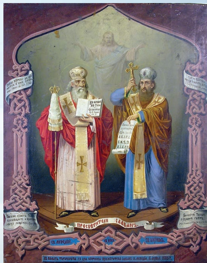
Иван Калиновский. Святители Кирилл и Мефодий. 1885

* Сокращение, означающее последнее зафиксированное в письменных источниках упоминание об иконописце.