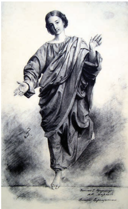
Учебный рисунок. Начало 1860-х годов. Бумага, карандаш. Из фондов Череповецкого музейного объединения