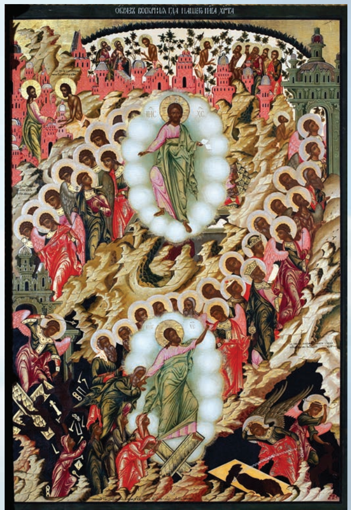
Стефан Соколов. Воскресение Христова. 1719. Из Воскресенского придела церкви Вознесения. Павлока, левкас, темпера