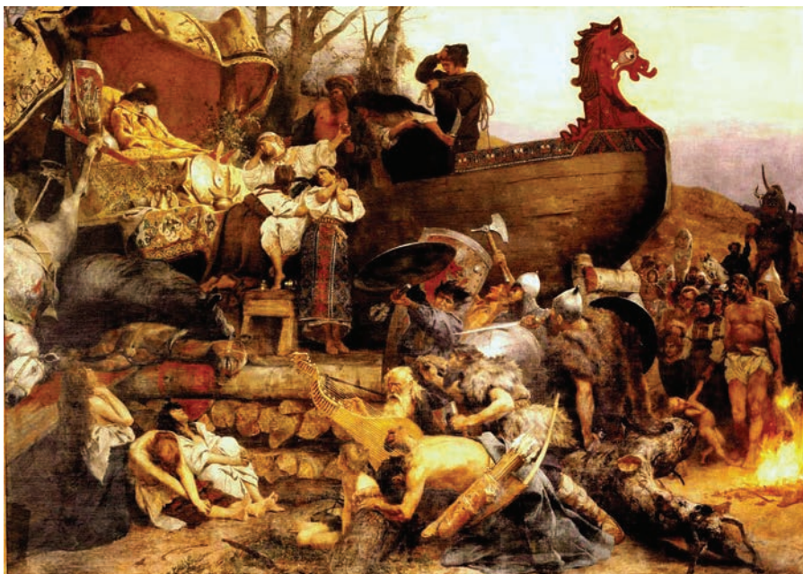
Г. И. Семирадский. Похороны знатного руса в Булгаре. 1883