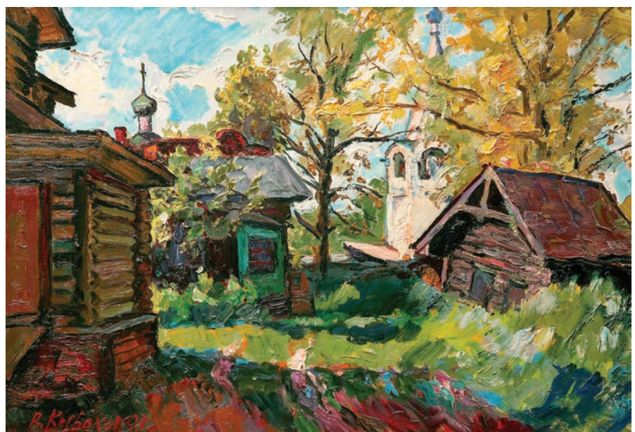
Вологодский дворик. 1998. ДВП, масло. Из собрания ВОКГ