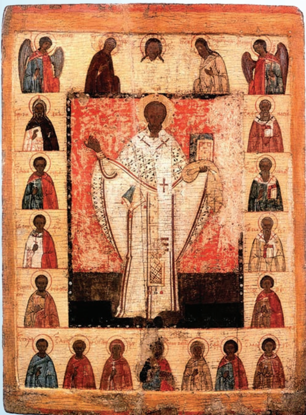
Святитель Николай Чудотворец (Зарайский), с деисусом и избранными святыми. Конец XV в. Паволока, левкас, темпера

Первые летописные сведения об устюжской иконописи относятся к XV столетию и связаны с именем иеромонаха Серапиона, который в 1447 году написал «по обету устюжан» чудотворный образ Спаса Нерукотворного ради избавления от свирепствовавшей в Устюге «морозной язвы». В 1823 году икона была поставлена в специально построенную для нее Спасскую Всеградскую церковь. О другом примере раннего устюжского иконописания сообщает Житие Прокопия Праведного, Устюжского чудотворца: в 1458 году над гробом святого возведена часовня и написан его первый иконный образ.