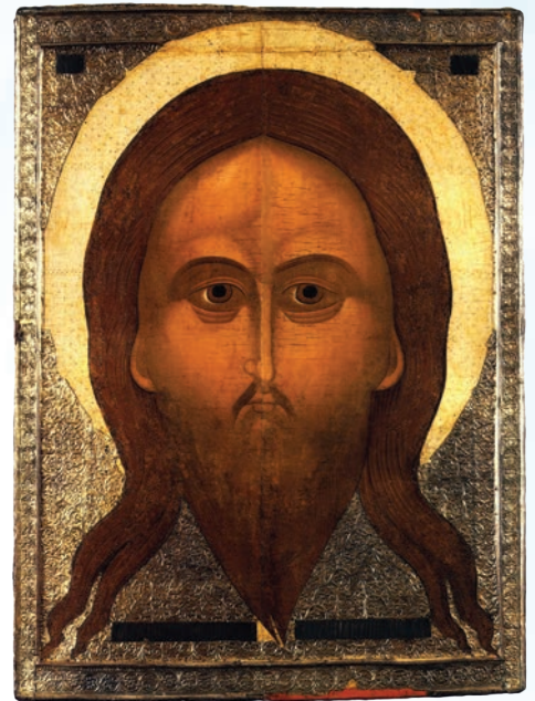
Спас Нерукотворный. XVI в. Паволока, левкас, темпера; оклад – серебро; басма

Большое влияние на формирование устюжской живописной культуры оказало и искусство Новгорода: граница с новгородскими землями проходила в районе истока Северной Двины. Традиции новгородской школы, в частности красный фон, прослеживаются в некоторых памятниках устюжской иконописи. К ним относится икона «Никола Зарайский, с деисусом и избранными святыми» (XV в.). Она примечательна еще и тем, что среди избранных святых имеется изображение Прокопия Устюжского – самое раннее из известных.