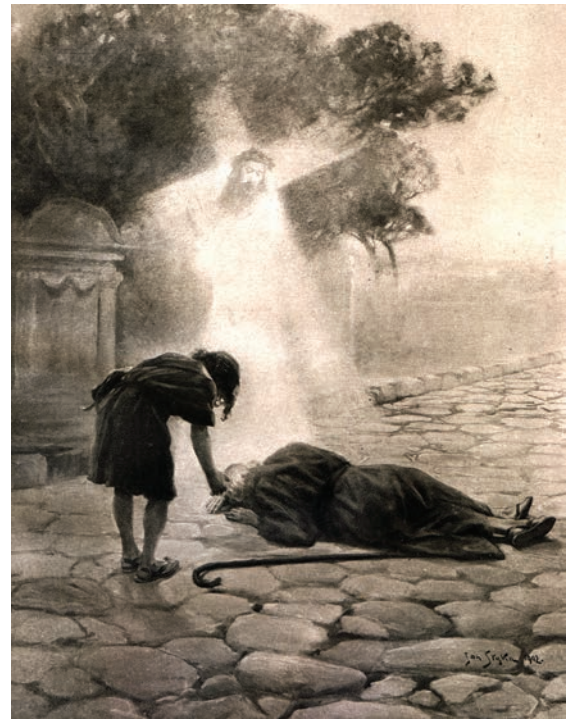
Я. Стыка. Иллюстрация к роману Г. Сенкевича «Quo vadis?». 1901

на» и «Камо грядеши?» Они свидетельствуют о широте интересов поэта-учителя. Первое из них – несчастный в русской поэзии пример экфрасиса (так по традиции, идущей от античности, называются описания живописных произведений в литературном тексте). Источник впечатления, послужившего толчком к созданию стихотворения, поэт не называет, но установить его можно. Это «Похороны знатного руса в Булгаре» (1883), большое историческое полотно Г. И. Семирадского, художника, имевшего шумный успех в конце XIX века. На нем с ужасающими подробностями изображены приготовления к древнему погребальному обряду. Вересов не только словесно воспроизвел облик персонажей и детали поразившей его картины, но и придал статичной живописной сцене динамику, повествуя о том, что и как произойдет далее, в ходе языческого обряда. Источником второго стихотворения является, по-видимому, роман польского писателя Г. Сенкевича «Quo vadis?» («Камо грядеши?»). Роман создавался в середине 1890-х годов, был переведен на несколько европейских языков и имел громадный читательский успех, что в немалой степени предопределило присвоение писателю Нобелевской премии в 1905 году. Идейным зерном произведения является апокрифический сюжет о том, как бе-