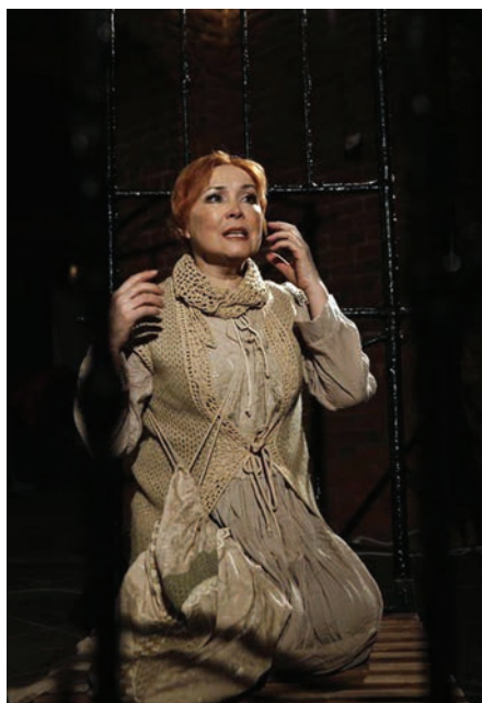
Заслуженная артистка РФ Ирина Джапакова