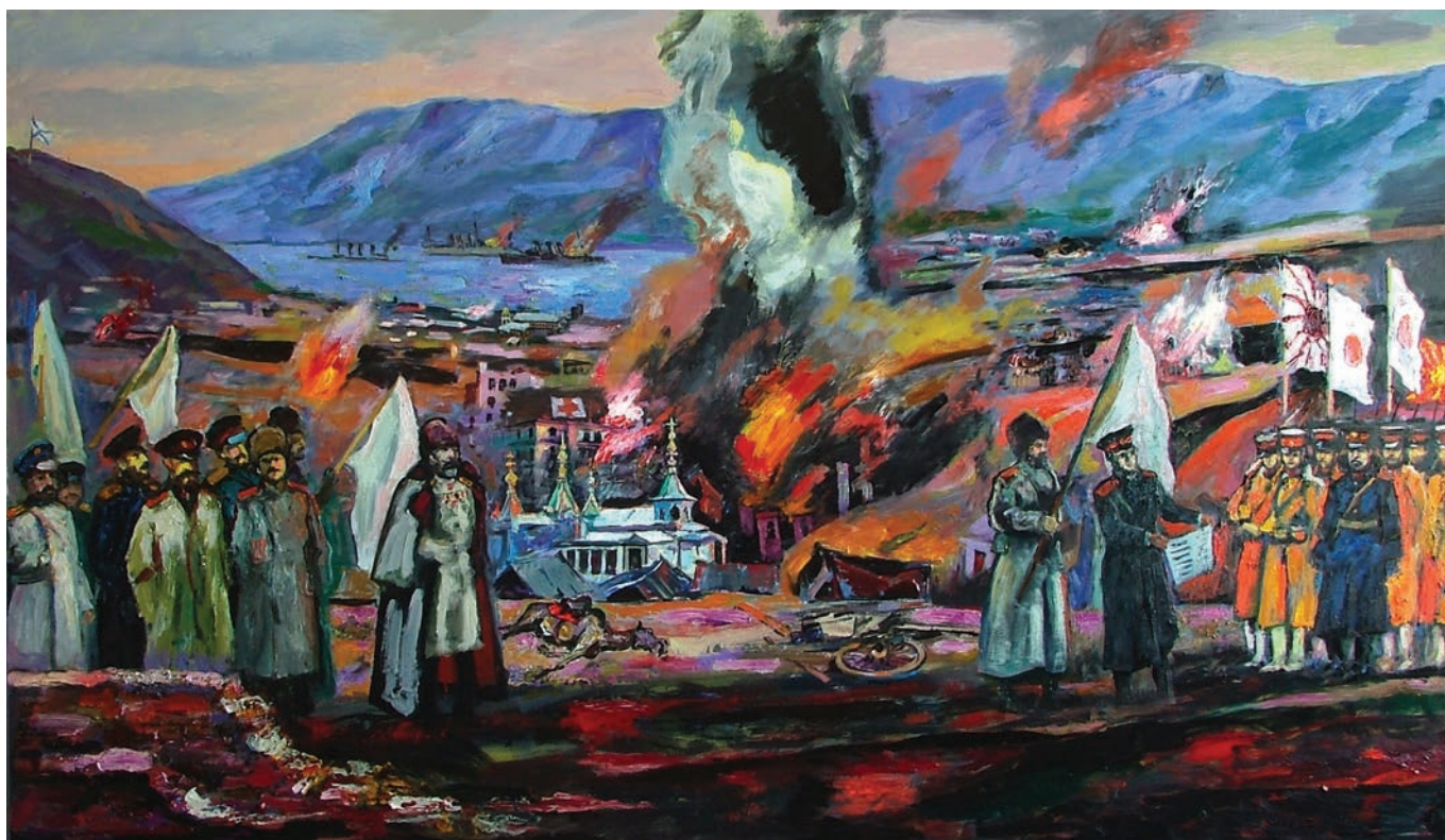
Сдача Порт-Артура 2 января 1905 года. 2004. Холст, масло. Частное собрание (Москва)