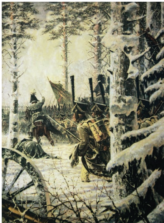
«В штыки! Ура! Ура!» (Атака). 1887-1895. Холст, масло

Период с 1863 по 1866 год стал для Верещагина этапом становления – и как личности, и как художника. Он неустанно работал над техникой живописи, помимо учебы и путешествий, писал этюды к картине «Бурлаки». Военные события на восточных окраинах России прерывают его мирные занятия. Он устремляется в Туркестан в надежде стать свидетелем триумфа русской армии, но увидевшая в реальности война потряса-