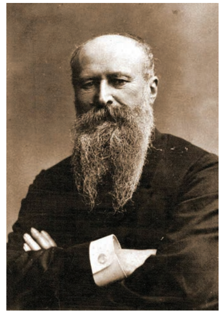
В. В. Верещагин. Фотография. 1890-е годы.

Родители категорически возражали против «дикого» намерения сына пренебречь блестящей карьерой морского офицера ради необеспеченной жизни начинающего художника. Отец отказал ему в помощи и предупредил о грозящей нищете. Но Василия это не остановило. Осенью 1860 года Верещагин был принят в Императорскую академию художеств. Конференц-секретарь Академии Ф. Ф. Львов выхлопотал для него небольшую стипендию Общества поощрения художников. Верещагин с увлечением погрузился в