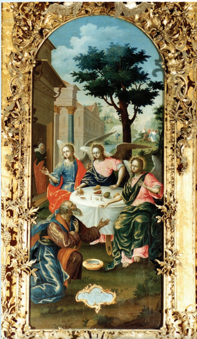
Алексей Колмогоров. Троица Ветхозаветная. 1778. Из Троицкого собора Троице-Гледенского монастыря. Паволока, левкас, темпера

В 1785 году по указу Екатерины II во всех городах Российской империи с целью «приращения ремесленного искусства» учреждена ремесленная управа, в состав которой входил и иконописный цех. В первые десятилетия