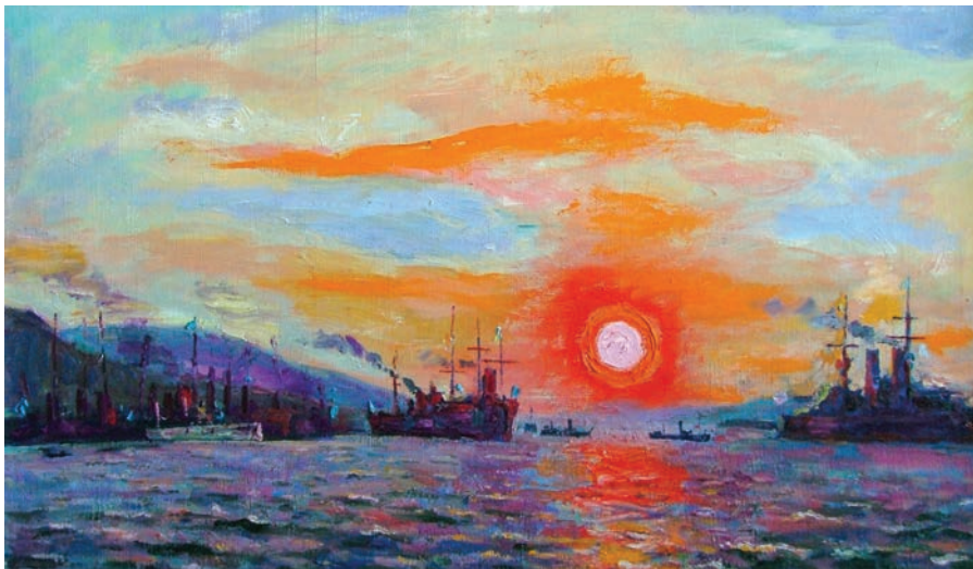
Май 1904 г. Раннее утро на внутреннем рейде Порт-Артура. 2003. Холст, масло. Частное собрание (Москва)

Эль Греко – смотри, неплохо ведь рисует! (Смеется). А это Ван Гог. Сделал мой портрет, а потом приходит через несколько дней и что-то подает мне. Я говорю: «Что это?» А он: «Ты глухой, так я тебе дарю свое ухо». Так родилась картина «Ван Гог дарит свое ухо глухому художнику».