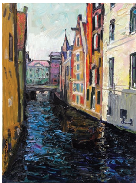
Северная Венеция. 2010. Холст, масло. Собственность автора

С недавних пор я занимаюсь еще и поэзией. В Вологде выпущены три сборника моих стихов, на некоторые даже песни написаны. Но главное со-