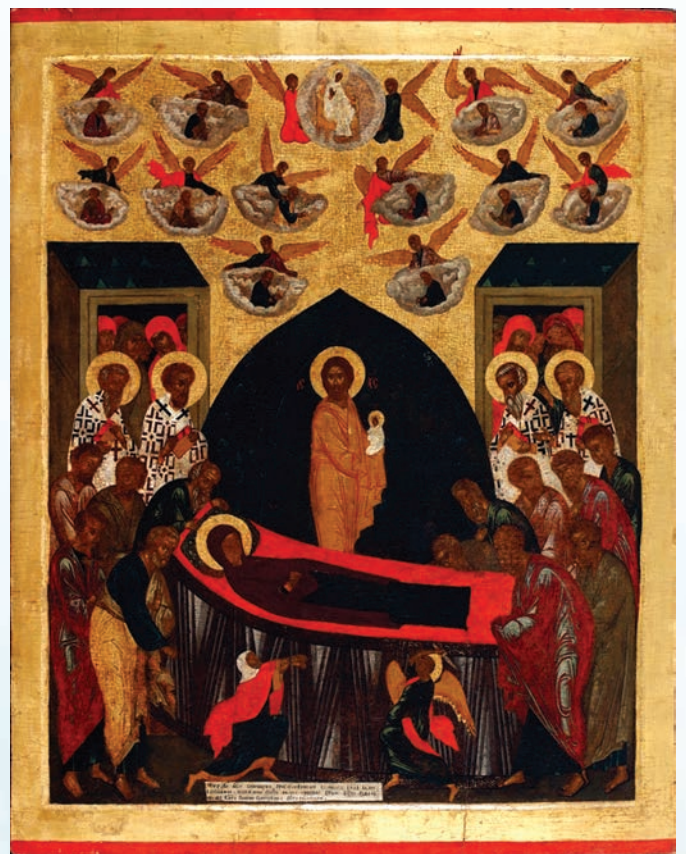
Успение Богородицы. Около 1496. Из Успенского собора. Вклад князя Семёна Борисовича Суздальского. Паволока, левкас, темпера