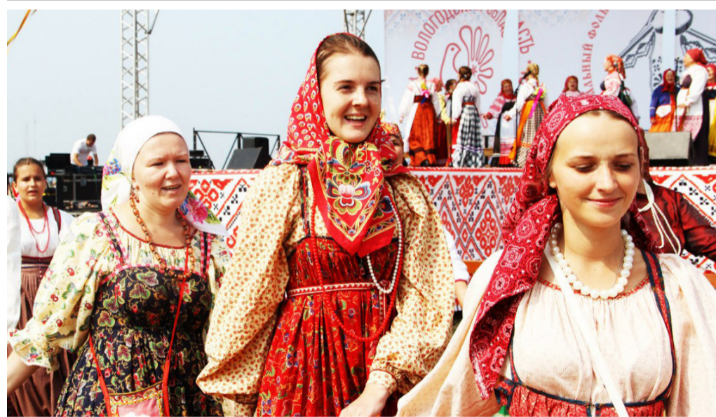
Выступления фольклорных коллективов в первый день фестиваля в п. Шексна

М ежрегиональный фольклорный фестиваль «Деревня – душа России» состоялся в Вологодской области в июле 2016 года. Мероприятие проходило в течение двух дней, участниками стали более 400 человек.