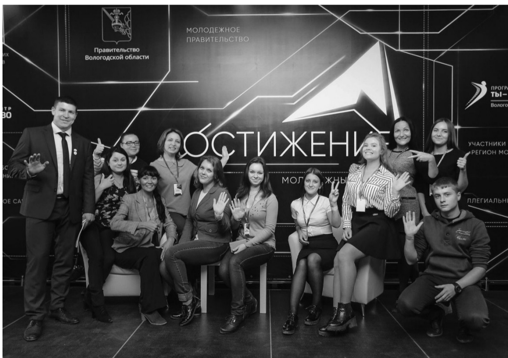
Участники и добровольцы форума «Достижение»

Мероприятие объединило более 800 молодых и активных людей из Вологды, Череповца и 22 муниципальных районов области. Образовательная программа форума была открыта на 7 площадках.