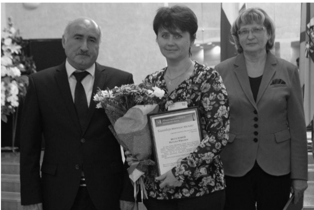
Члены Общественной палаты Вологодской области поздравляют представителей Общественного совета г. Череповца

ПО МАТЕРИАЛАМ САЙТА op35.ru