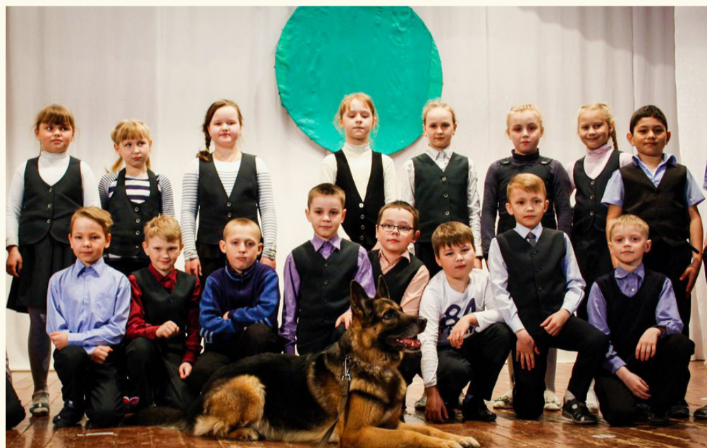
Открытый урок для школьников из п. Сосновка Вологодского района

И стория Клуба «Добрый Пёс» началась в июле 2015 года, когда инициативная группа молодых людей совместно с руководством Вологодского общества защиты животных «Овчар-команда» приняла решение обучить подопечную приюта овчарку Амину таким образом, чтобы она могла быть полезной для общества.