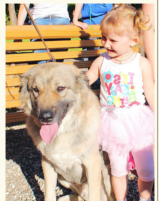
Собака Амина - модель на фестивале «Вологда-ГДА»

ного фотопроекта, организованного Молодёжным центром Гор.Сот35 в помощь бездомным животным, и побывала в роли модели в нескольких фотозонах городских фестивалей «Вологда-ГДА».