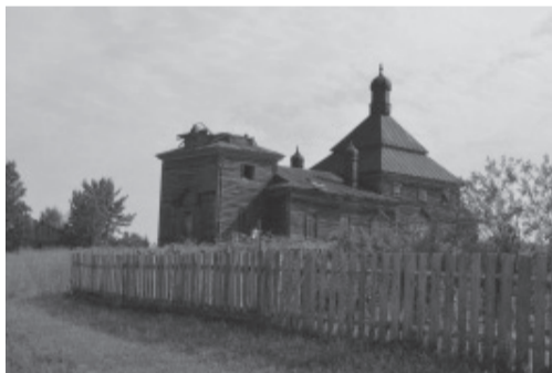
Храм Иоанна Предтечи в д. Великий Двор

Группа волонтеров из Вологды и Петрозаводска посетила деревню Великий Двор Вытегорского района.