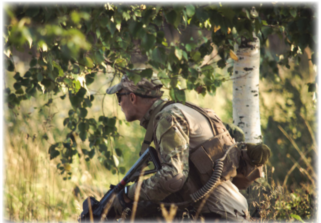
В ожидании игроков из команды противника

Поскольку страйкбол – командный вид спорта, то все участники объединяются в три противоборствующие стороны: «федеральные войска», «террористическая организация» и «мафиозный клан». Для всех в сценарии были поставлены задачи – федералы должны были обезвредить преступни-