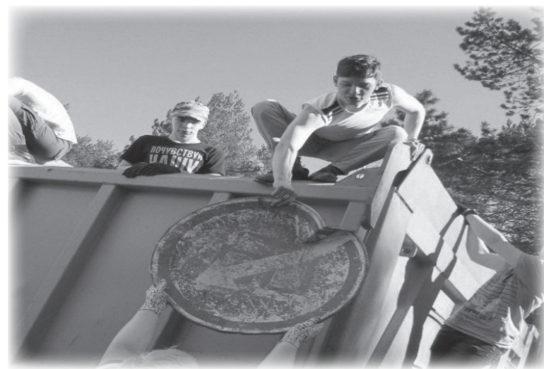
Волонтеры «Ассоциации лидеров»

Инициативную и целеустремленную молодёжь из «Ассоциации лидеров» любят и ценят в родном селе. Ребят регулярно награждают грамотами и дипломами различного уровня за участие в экологической, волонтерской деятельности, работах по благоустройству поселка и активную жизненную позицию.