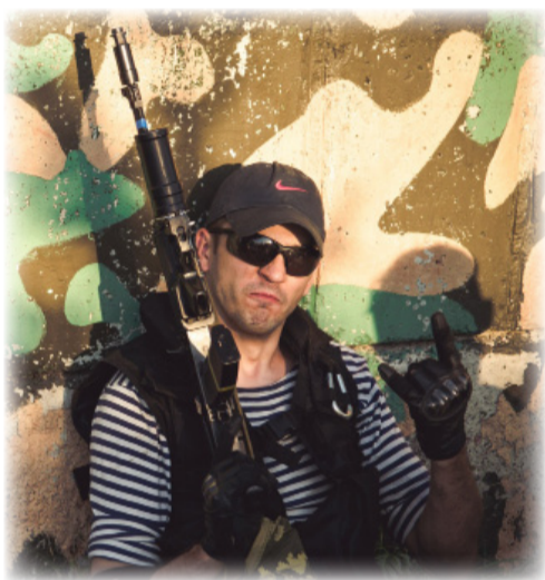
Участники игры к бою готовы!

АЛЬБИНА БОРОЗДИНА