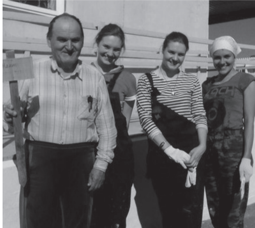
Члены молодежной трудовой бригады РСО

Уровень нравственности общества выражается в том, как оно заботится о людях старшего возраста. Благотворительные и общественные организации занимаются популяризацией добровольчества, реализуя множество проектов по вовлечению, в том числе молодых людей, в волонтерскую деятельность. Однако, не все даже взрослые люди готовы помочь пенсионеру. Согласно опросу, проведенному авторами проекта «Добро Mail. Ru», лишь каждый восьмой россиянин готов это сделать.