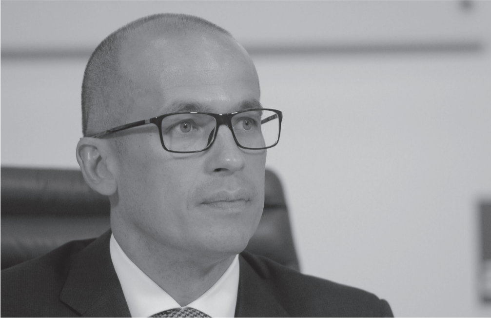
Общественный деятель Александр Бречалов

Общественная палата Российской Федерации (ОП РФ) будет добиваться максимального упрощения и открытости процедуры получения некоммерческой организацией (НКО) статуса исполнителя общественно полезных услуг. Об этом рассказал секретарь Общественной палаты РФ Александр Бречалов.