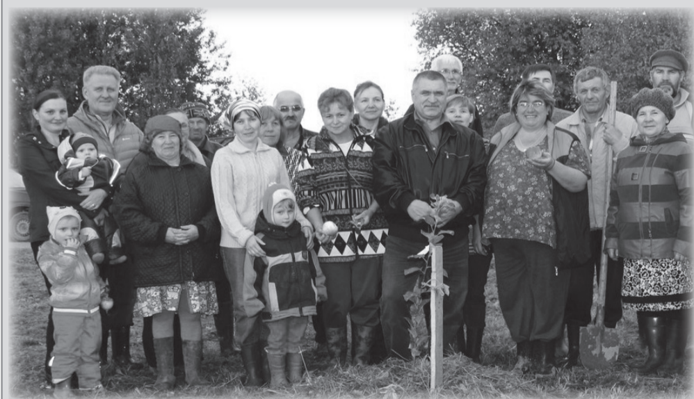
Участники проекта высадили первое дерево яблоневого сада

21 сентября в деревне Андреевская Тарногского района Вологодской области стартовал проект «Деревенский сад».