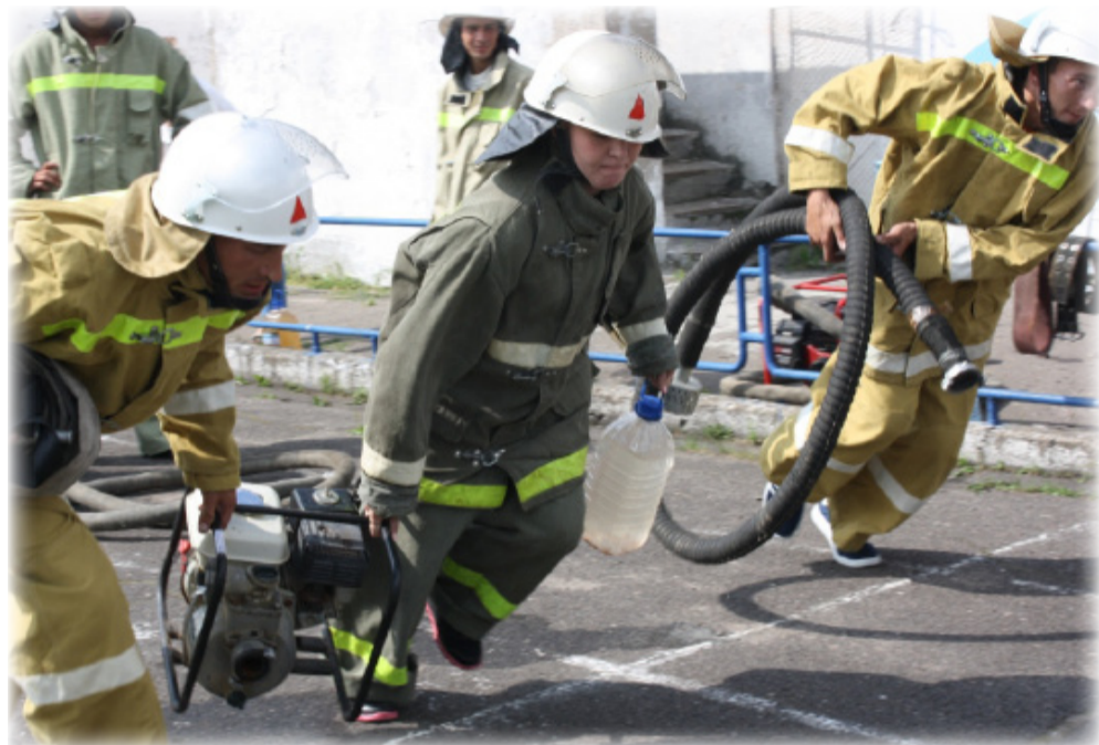
Третий этап соревнований - команда добровольцев бежит к цели с мотопомпой и пожарным рукавом в руках

22 июля в городе Соколе прошли XIV районные соревнования по пожарно-прикладному спорту среди добровольных пожарных дружин сельских поселений. Организатором выступила Администрация Сокольского муниципального района совместно с 3 отрядом Федеральной противопожарной службы по Вологодской области и Сокольским отделением Всероссийского добровольного пожарного общества (ВДПО).