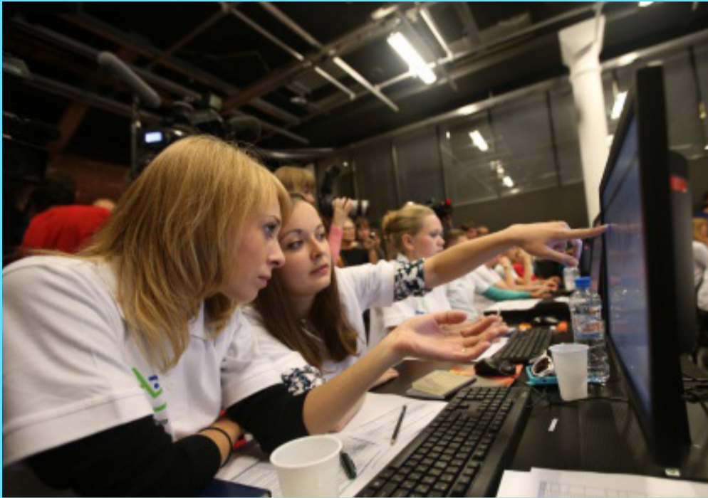
Интернет-площадка объединит добровольцев по всей России

Е динственный портал для волонтеров «Добровольцы России» будет создан в России. Виртуальное пространство станет как информационным ресурсом, где можно узнать о ближайших событиях и акциях добровольчества, так и платформой, позволяющей вести единую базу данных запросов и предложений добровольческой помощи.